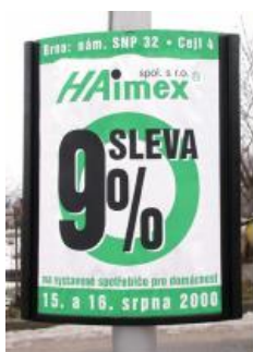
Obrázok 2 reklamná plocha na vylepovanie plagátov formátu A1

V tejto položke sú zahrnuté aj ďalšie typy reklamných plôch, ktoré sú potenciálnym zdrojom ďalších vedľajších príjmov koncesionára.