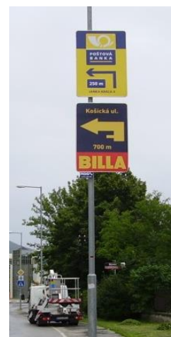
Obrázok 1 Informačno-navigačná tabuľa INS

Tabule informačno-navigačného systému (INS) sú umiestňované na stožiare verejného osvetlenia vo výške min. 3m. Tabule slúžia pre navigáciu motoristov k „bodom záujmu“ – obchodom, firmám, prevádzkam, organizáciám, čerpacím staniciam, obchodným centráam a pod. Na tabule je spravidla umiestnené logo a názov organizácie, smerová šípka určujúca smer odbočenia navigovaného motoristu s uvedením vzdialenosti k odbočke. Príjmy z prenájmu stožiarov za účelom osadenia INS, montážnych prác na montáži a demontáži sú vedľajším príjmom koncesionára.